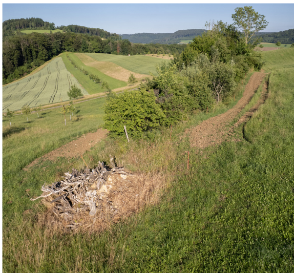
Ein kombinierter Ast- und Steinhäufen, eine Hecke, offener Boden und neu gepflanzte Hochstammbäume – so entstehen wieder Lebensräume.

Wir bauen Ast- und Steinhäufen, legen Blumenwiesen, Buntbrachen, offene Böden und extensive Weiden an, pflanzen Hochstammbäume, Gebüschgruppen und Hecken und hängen Nistkästen auf, um die Landwirtschaftsflächen aufzuwerten. Dadurch finden viele der mittlerweile selten gewordenen Arten hier wieder einen Raum zum Leben.